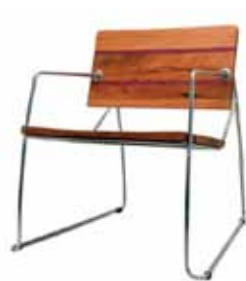
CADEIRA MODELO BIANCA