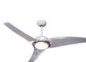
VENTILADOR DETETO LATINA AIR CONTROL