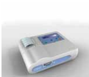
ELETROCARDÍGRAFO TEB C30+

Empresa: TEB – Tecnologia Eletrônica Brasileira