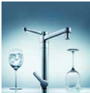
TORNEIRA COM FILTRO TWIN