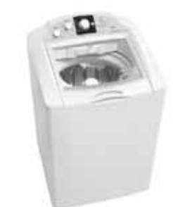
LAVADORA GE ECOPERFORMANCE

Empresa: Mabe Hortolândia Eletrodomésticos