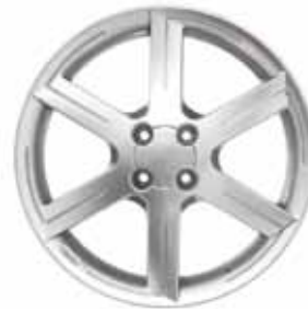
RODA S183 – LINHA SILÍCIO 7