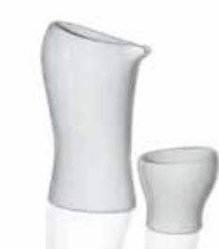
LINHA ÁGUA – JARRA E COPOS

Empresa: Exea Criação e Objetos de Arte e Design