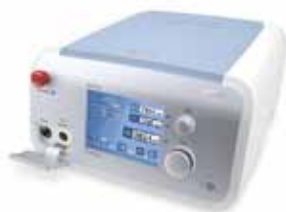
MITRA YELLOW LASER